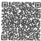
แบบรายงาน

สำนักงานส่งเสริมการปครองทอ้งถึนจ้งหวัด กลุ่มงานบริการสาธาณะทอ้งถึนและประสานงานทอ้งถึนอ้าเภอ โทร. ๐๘๐-๐๔๒๕๗๔๑